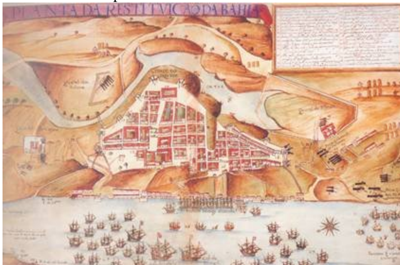
Figura IV - Planta de Salvador (1625)

O fato de se localizarem na costa litorânea, determinou outra tendência das cidades brasileiras estabelecidas durante o período colonial: a linearidade.