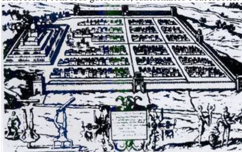
Figura I - Vista européia de Cuzco, gravura do século XVI.

Os colonizadores espanhóis, ao atingirem as terras altas da América, encontraram civilizações estruturadas com caráter urbano, que chegaram a parecer maiores e melhor organizadas que as cidades européias da época (Ver Figura I). O relevo escarpado, a primitividade dos meios de trabalho e os elos comunitários, forçavam a fixação das comunidades em um vale fértil que deveria ser explorado ao máximo, viabilizando a produção de um excedente que permitiu a divisão social do trabalho e deu origem a cidades – sedes do poder do estado, residência da nobreza, com seus guerreiros, funcionários e sacerdotes.